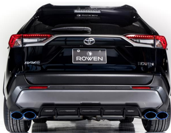
※Parallel Dual Type