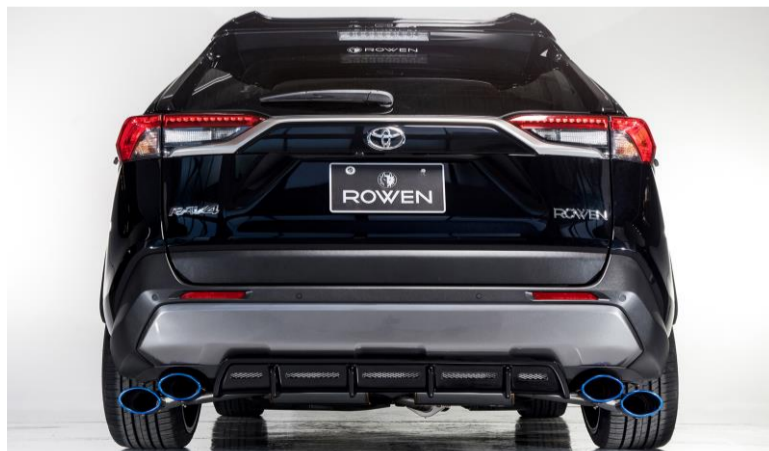
※Vertical Dual Type

製造/販売元 株式会社 E・Rコーポレーション ROWEN事業部 愛知県豊田市堤本町山畑7 TEL:0565-52-8555