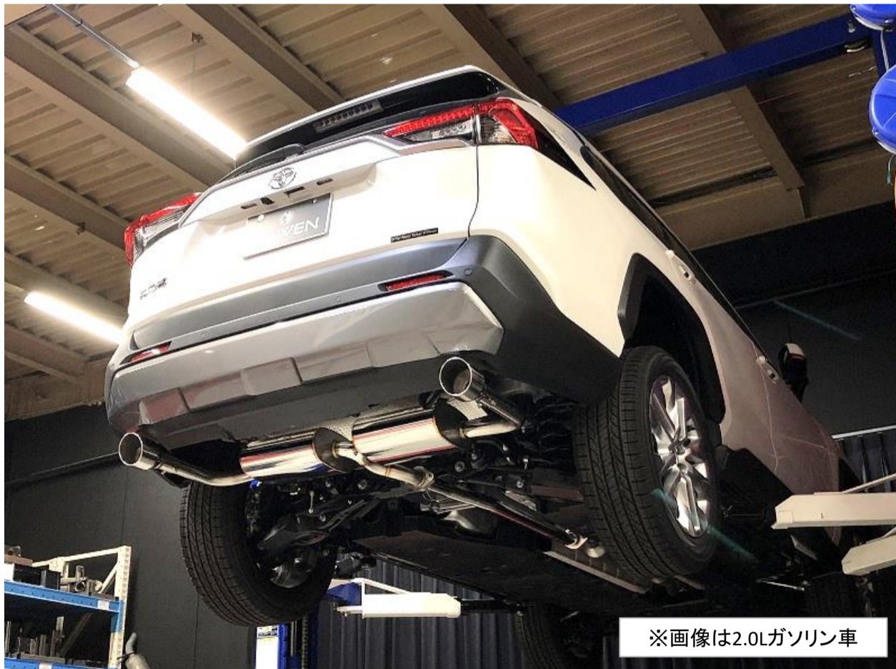
※画像は2.0Lガソリン車

製造/販売元 株式会社 E・Rコーポレーション ROWEN事業部 愛知県豊田市堤本町山畑7 TEL: 0565-52-8555