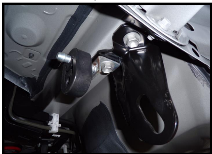
【写真① 車両左側後方】